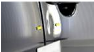
Deuken groter dan 2,5 cm