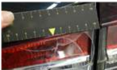
Gaten en/of stukken uit de verlichting