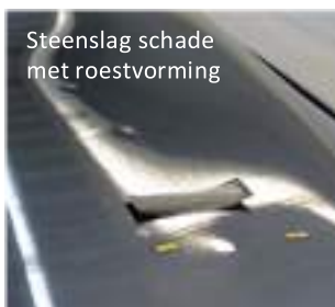
Steen­slag schade met roestvorming