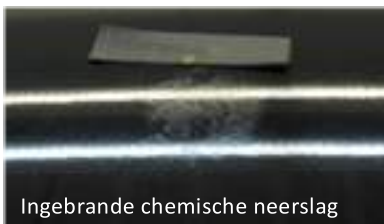
Ingebrande chemische neerslag