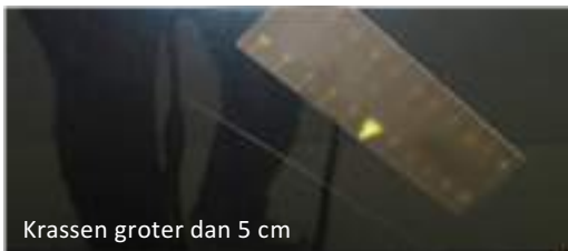
Krassen groter dan 5 cm