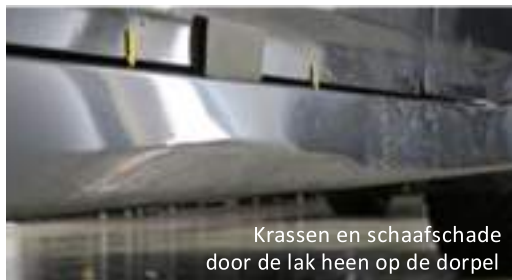
Krassen en schaafschade door de lak heen op de dorpel