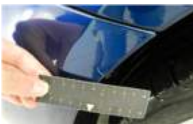
Gaten en/of scheuren in de bumpers

Een auto dient zonder reclame te worden ingeleverd, tenzij hierover in de overeenkomst aanvullende afspraken zijn gemaakt.