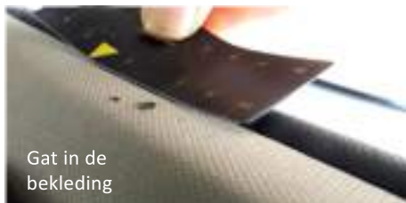
Gat in de bekleding